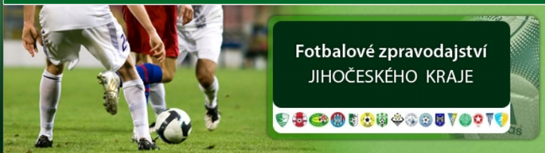
FOTO: Vítězství nad Větrovy zajistily řepečským fotbalistům dvě penalty